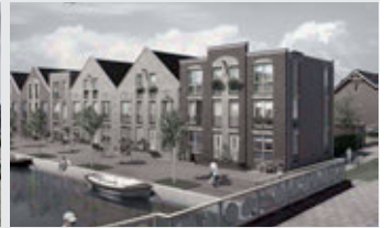
Bijzondere kadewoningen type Selder

Woonoppervlakte ca. 103 m 2 Koopsom vanaf € 195.000,- v.o.n.