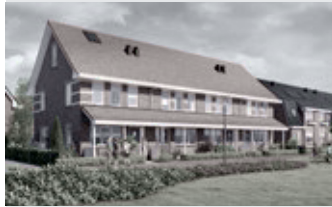
Heerlijke gezinswoningen type Postelein

Woonoppervlakte ca. 98 m 2 Koopsom vanaf € 187.500,- v.o.n.