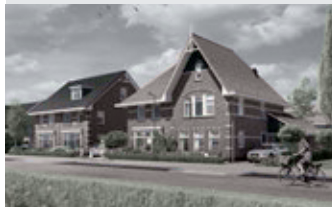
Twee-onder-een-kapwoningen type Pattison

Woonoppervlakte ca. 126 tot 141 m 2 Koopsom vanaf € 243.000,- v.o.n.