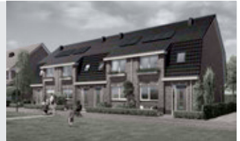
Fijne starterswoningen type Savooi

Het voormalig veilingterrein De Wuyver in Noord-Scharwoude verandert. De oude bedrijfsgebouwen maken plaats voor woningbouw. Fase 1 t/m 5 zijn verkocht, deels opgeleverd of in aanbouw. Nu starten we met de verkoop van fase 6 met 5 verschillende woningtypen.