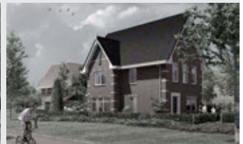
Fraaie vrijstaande woning type Mirabel

Woonoppervlakte ca. 135 tot 141 m 2 Koopsom vanaf € 304.000,- v.o.n.