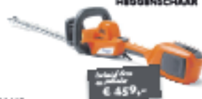
HUSQVARNA 126 LIM09 HEGGENSCHAAR