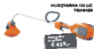
HUSQVARNA 126 LIC TRIMMER