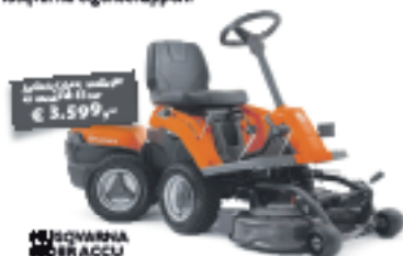
HUSQVARNA 400R ACCU

De nieuwe Husqvarna Arvo Serie zijn er in een serie sterk performende accu-versies. U krijgt de voordeel van kwaliteitsproducten, een perfect evenwicht, stille werking, geen emissies, universele accu's die in alle handgereedschap passen en tal van unieke Husqvarna eigenschappen.