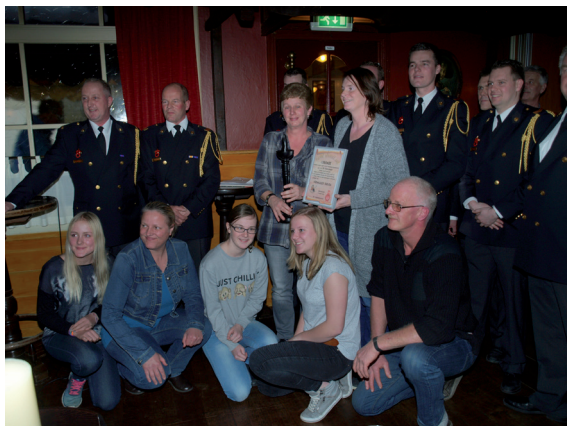
De vrijwillige brandweer geeft de Fakkeldrager door aan de vrijwilligers van de Veenhuizer Hoeven.

Dit verdient veel respect en daarom zijn zij met recht Fakkeldrager 2016!