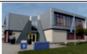
Energie Service Noord West Ons gezamenlijk onderhoudsbedrijf voor verwarming en binnenklimaat