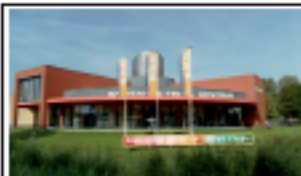
Sanifair & Tegel Centrum / Alkmaar Ons gezamenlijke showroom